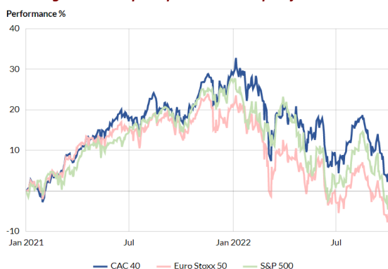
Progression des principaux indices depuis janvier 2021