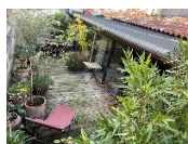
Appartement T3 avec terrasse Quinconces 100 m 2 987 000€ FAI