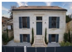
Maison au Bouscat – 250 m 2 5 chambres – jardin de 680 m 2 avec piscine Nous contacter pour plus d'informations