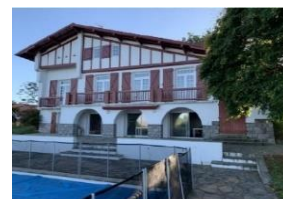
Maison à Espelette – 320 m 2 5 chambres – Pool-house et piscine 1 200 000 € FAI - Exclusivité